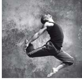
4 Ángel es _____.