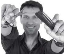
5 Luis es _____.