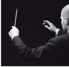
3 Pedro es _____.