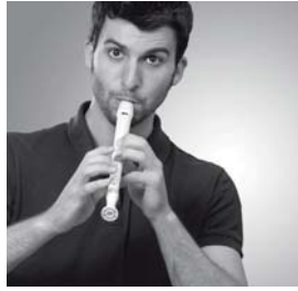
2 Tomás es _____.