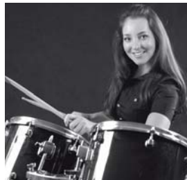
8 Ana es _____ de un grupo de rock.