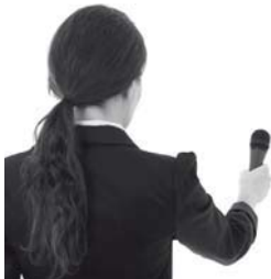
7 Carmen es _____.