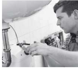
6 Jaime es _____.