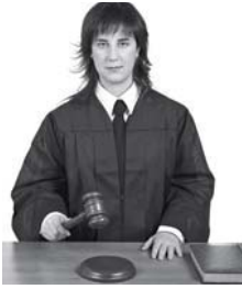
1 Sonia es _____.