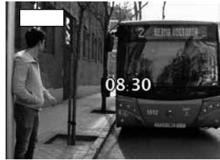
3 Coger el autobús.