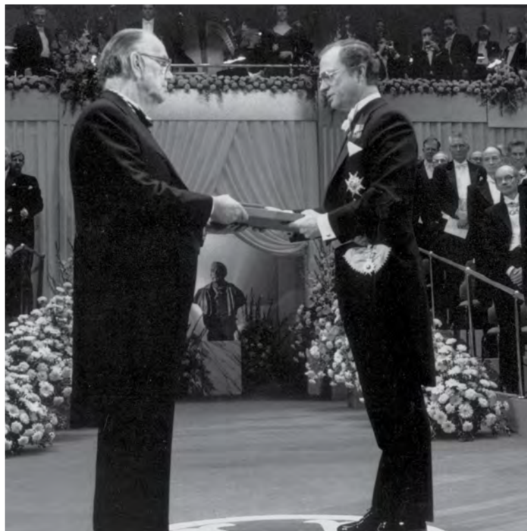
Camilo José Cela recibe el Premio Nobel.

8 ¿En qué año recibió Camilo José Cela el Premio Nobel de Literatura?