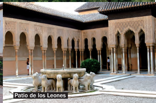
Patio de los Leones