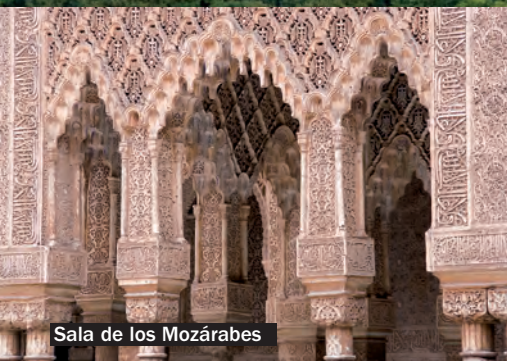
Sala de los Mozárabes