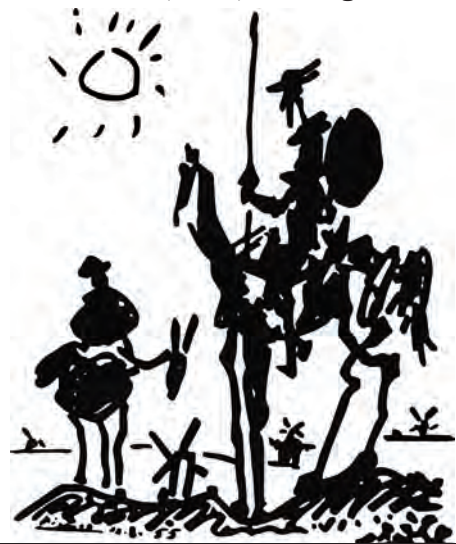
Dibujo de Don Quijote, pintado por Picasso

Su obra (7) _____ (evolucionar), y pasó por distintas épocas, en las que sus cuadros (8) _____ (mostrar) la pobreza, el amor, la naturaleza... En 1937 (9) _____ (pintar) el Guernica, un cuadro sobre la guerra, considerado una de las obras más importantes del siglo xx. Una de sus últimas exposiciones (10) _____ (ser) en el Museo de Louvre en 1971, cuando el artista tenía 90 años. Picasso (11) _____ (morir) en Mougins en 1973.