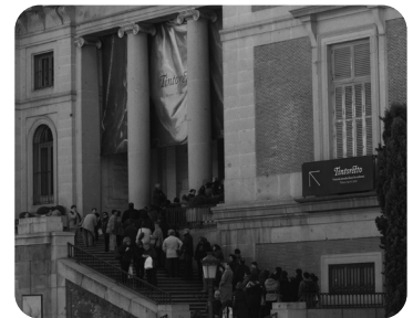
5 Ubicación del Museo del Prado