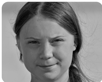
6 Suecia, 2003