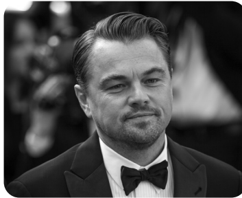
2 Nombre del actor