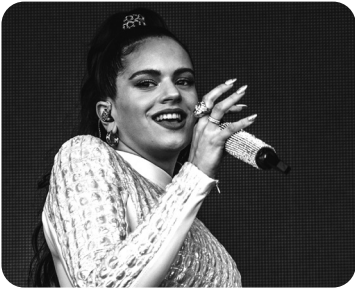
1 Cantante española ¿Quién es esta?

10 Formula preguntas sobre las informaciones que te ofrecemos. Usa alguno de los interrogativos del centro.