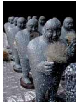
Carlos Runcie Tanaka. (1958) El juego (todos lo llevan) . 2003 Fotografía: Carlos Runcie Tanaka/ Frank Sotomayor