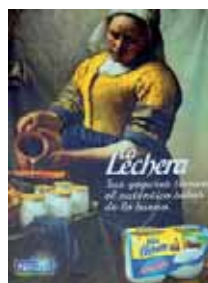
Yogures La Lechera