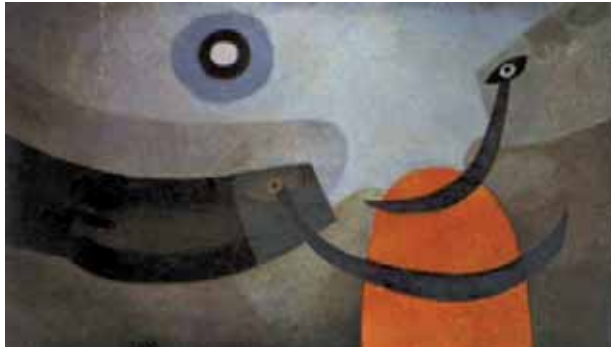
Tilsa Tsuchiya Castillo (1929-1984). Aro negro . 1967